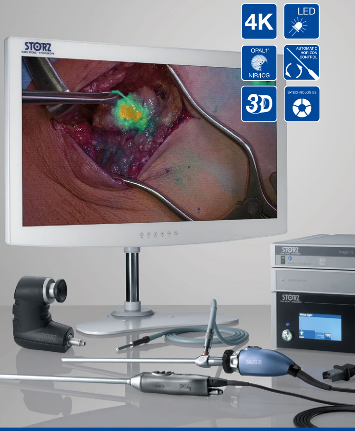
IMAGE1 S™ Rubina® – mORe to discover